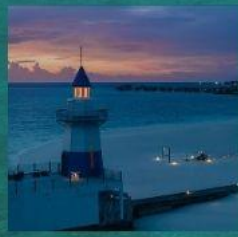
Light House Restaurant