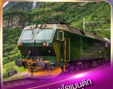
รถไฟสายโรเมนติก ฟลัมส์บาน่า