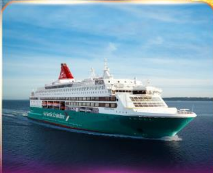
เรือสำราญ GO NORDIC CRUISE LINE