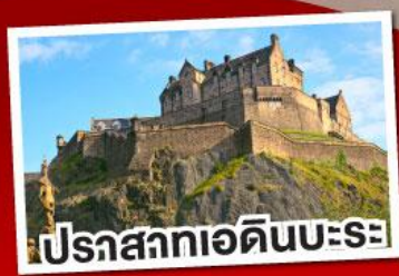
ปราสาทเอดิเนบะระ