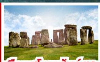
เยือนสโตนเฮนจ์ และ พีพีร์กัทท์โรมันบาร