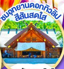
ชมอุทยานดอกทิวลิป สีสันสดใส