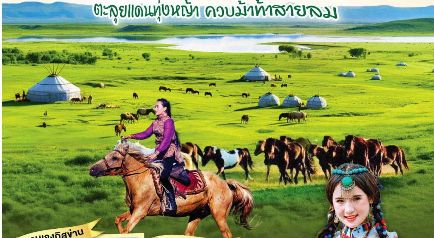
สุสานเจงกิสข่าน