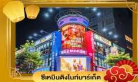
ช้อปปิ้งไนท์มาร์เก็ต