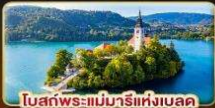
โบสถ์พระแม่มาเรียแห่งเบลด

บินตรงสู่ออสเตรีย สัมผัสความงามไข่มุกแห่งท้องทะเลยุโรปใต้