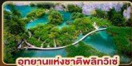
อุทยานแห่งชาติพลิทวิเช่