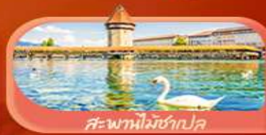
สะพานไมซ์าปก