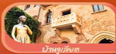
บ้านจูเลียต