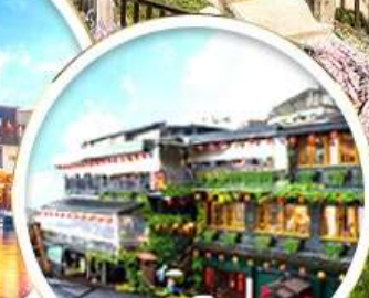
หมู่บ้านโบราณ จิวเฟิน