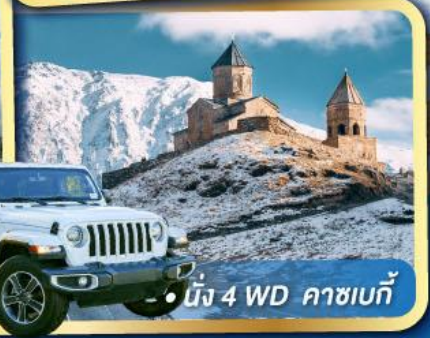
• นั่ง 4 WD คาซเบก