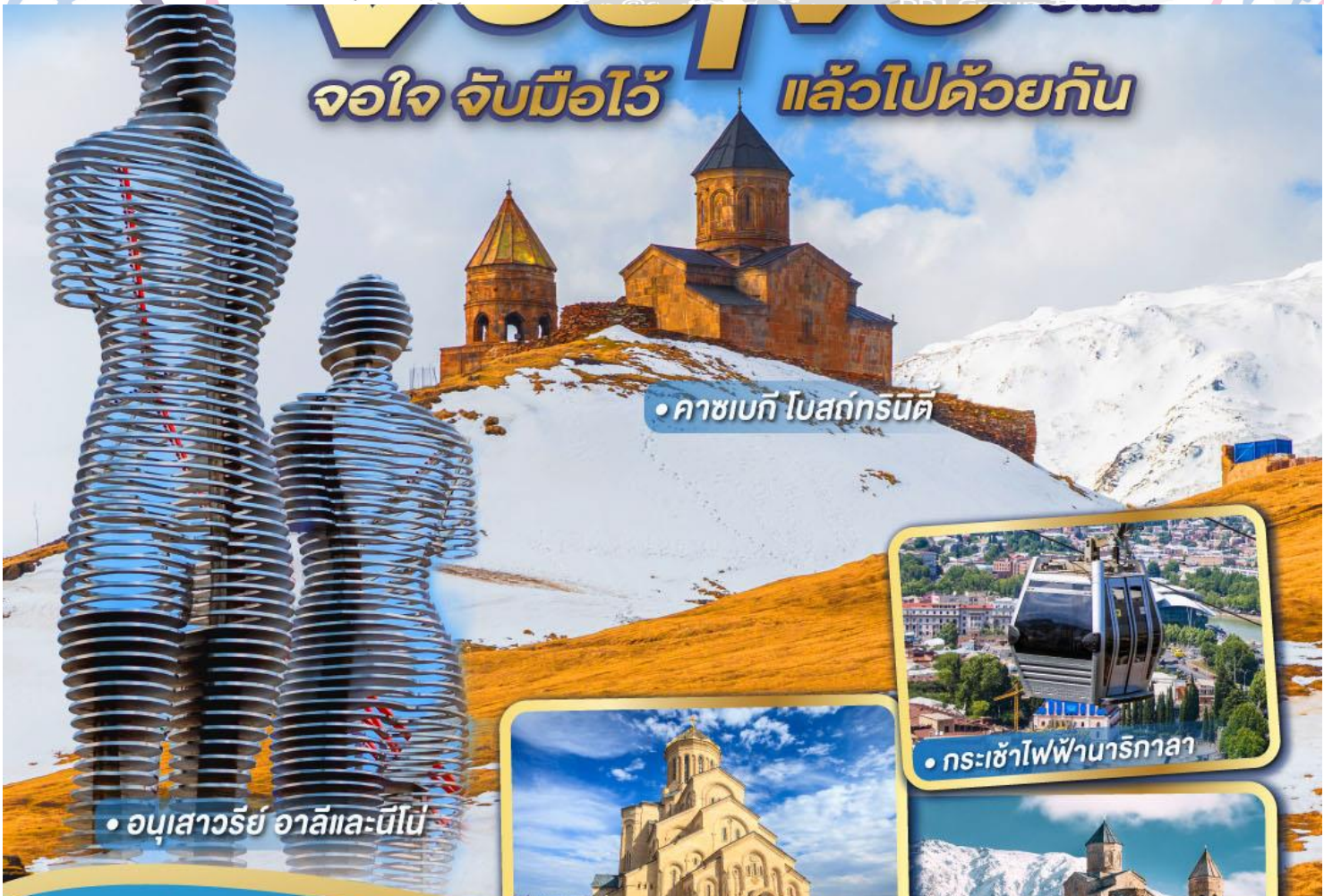
• คาซเบก โปสท์การ์ด