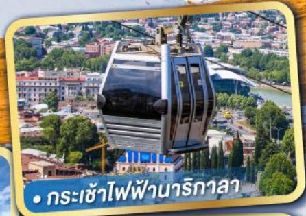
• กระเช้าไฟฟ้านาริกาลา