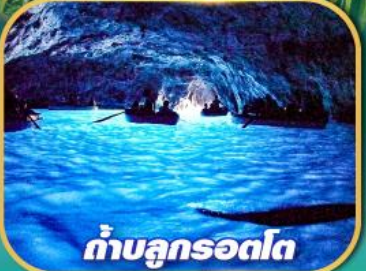
ถ้ำบลูกรอดโก