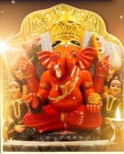
องค์สิทธินายิก