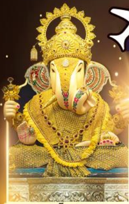
องค์ดีกชู่พิเศษ