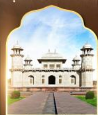
ทัชมาฮาลน้อย