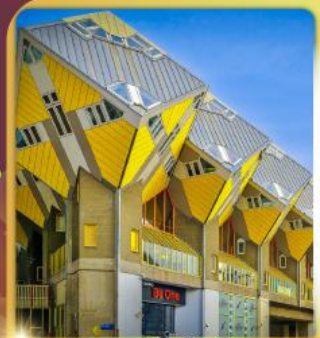
บ้านลูกเต่า โค้ดคูบัส

“ล่องเรือหลังคากระจก” ชมกรุงอัมสเตอร์ดัม