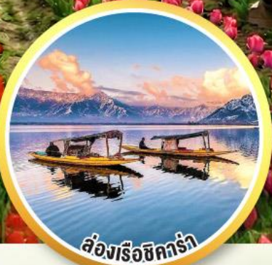
ล่องเรือชิคร่า