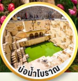
บ่อน้ำโบราณ