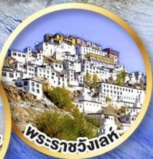
พระราชวังเลห์