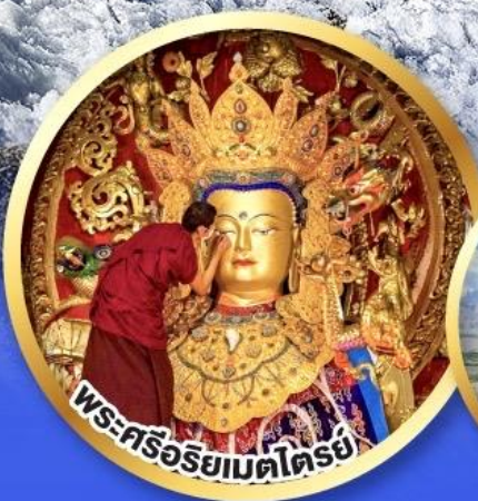
พระศรีอริยเมตไตรย์