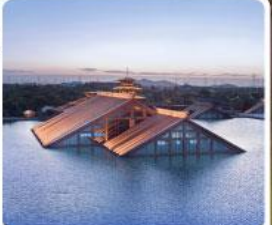
พิพิธภัณฑ์ไดน้ำกวางฟู่หลิน