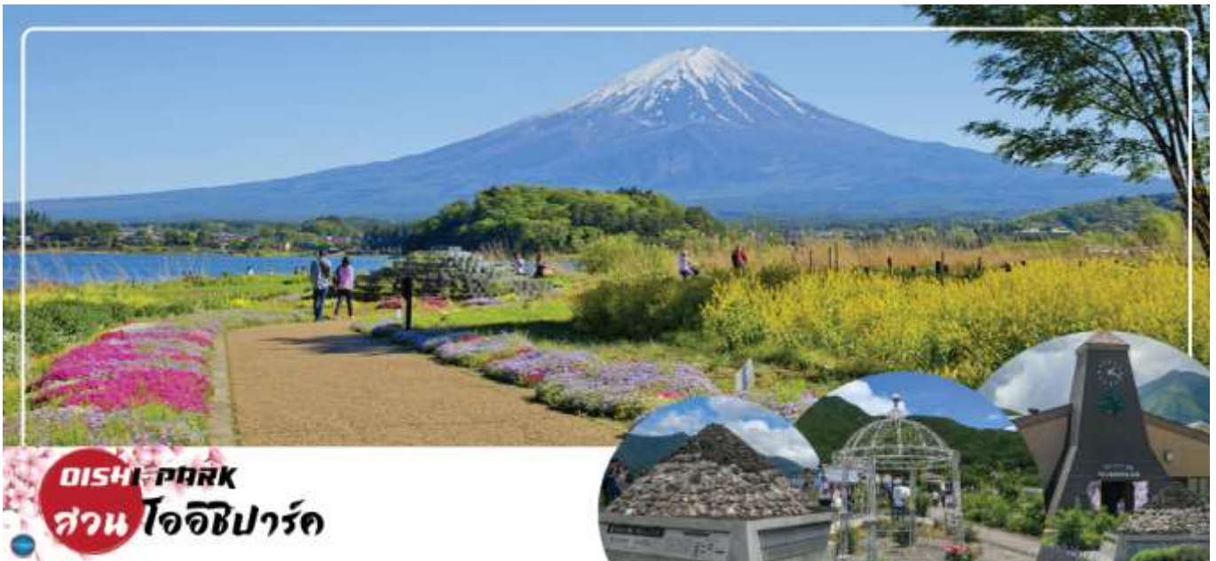
OISHI PARK สวน โออิชิพาร์ค

วันที่สาม จังหวัดยามานาชิ – สวนสาธารณะโออิชิ – พิพิธภัณฑ์ญี่ปุ่น – โกเทมบะพรีเมียมเอาท์เล็ต – เมืองนาริตะ – อีออน มอลล์ นาริตะ