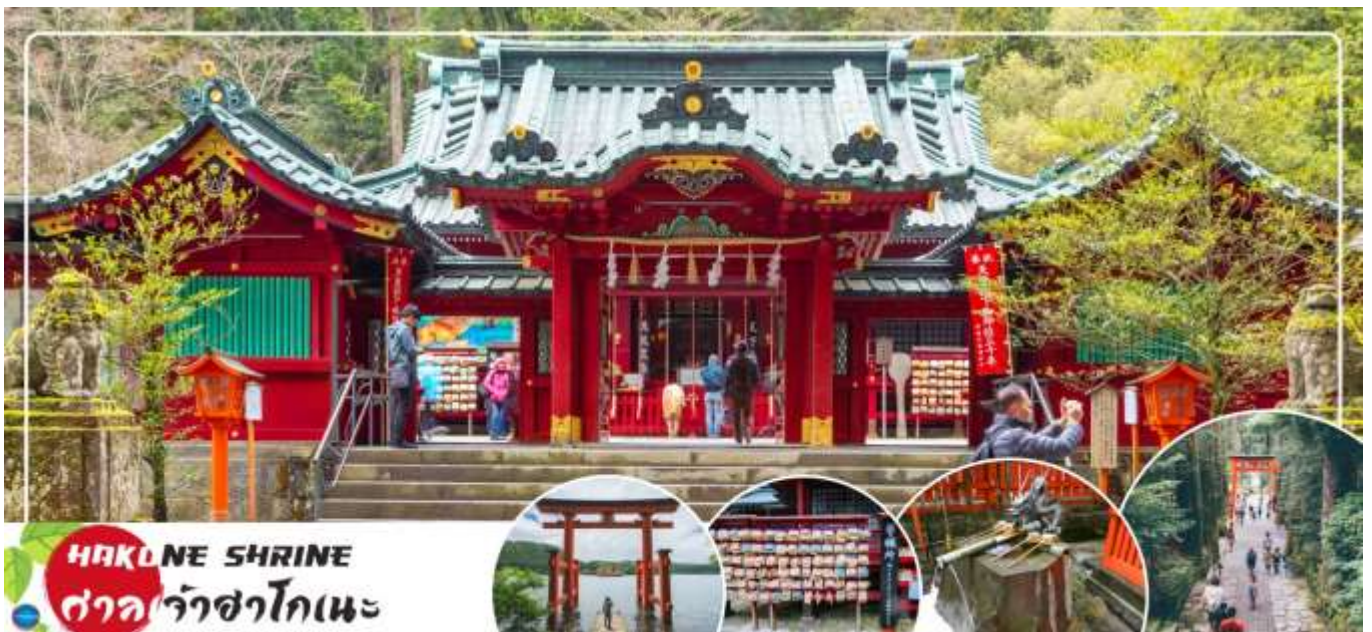
HAKONE SHRINE ศาลเจ้าฮาโกเนะ

จากนั้นนำท่าน ชมวิวทะเลสาบ 5 ศาลเจ้าฮาโกเนะ (Hakone Shrines) (ใช้เวลาเดินทางประมาณ 30 นาที) ศาลเจ้าเก่าแก่ในศาสนาชินโต ตั้งอยู่บริเวณตีนเขาฮาโกเนะ และอยู่ริมทะเลสาบอะชิ จังหวัดคานากาวา ประเทศญี่ปุ่น ไฮไลท์!!! เส้าโทริอิสี่แดง ริมทะเลสาบที่เป็นจุดถ่ายรูปยอดนิยม อีสาระให้ท่านขอพรและถ่ายรูปตามอัธยาศัย