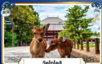
วัดโทไดจิ