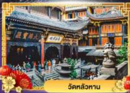
วัดหลิวทาน