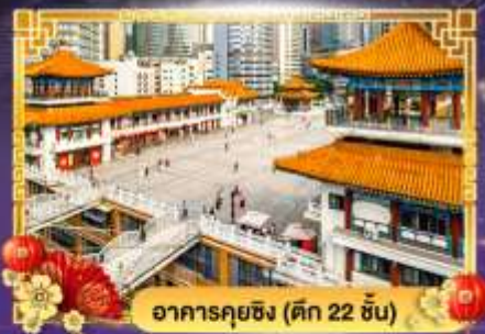
อาคารคุยซิง (ตึก 22 ชั้น)