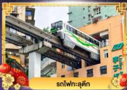
รถไฟฟ้าลัดคิว