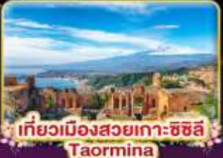
เที่ยวเมืองสวยเกาะซซิลี Taormina