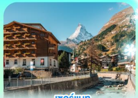
เชอร์แมท