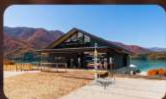
AO Lakeside Cafe 1

HOTEL NARITA AREA หรือเทียบเท่ามาตรฐานญี่ปุ่น