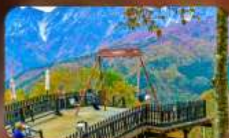
ฮาคุบะ-อิวาซากะ