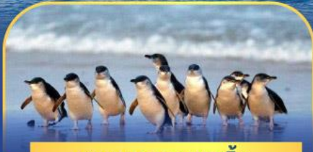
พาเหรดนกเพนกวิน