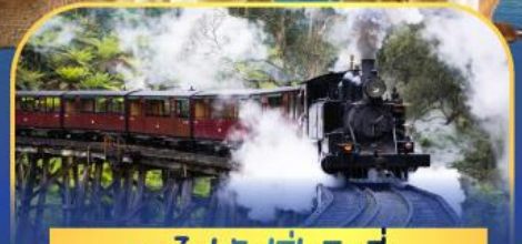
รถไฟพัพฟิงบิลลี่

ล่องเรือชมอ่าวซิดนีย์พร้อมรับประทานอาหารกลางวัน และ เข้าชมสวนสัตว์การองก้า