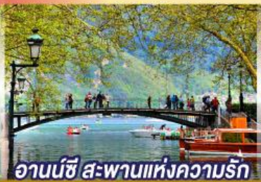
อานันชี สะพานแห่งความรัก