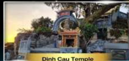
Dinh Cau Temple