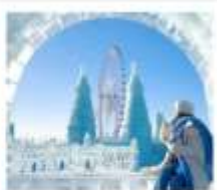
ICE & SNOW FEST.