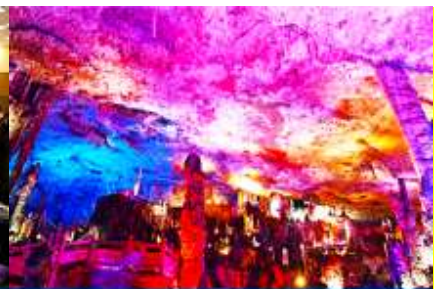
ถ้าเก่าสวรรค์วิวกียนต์

วันที่สาม เมืองจางเจียเจี๋ย-ศูนย์แพทย์แผนจีน -ศูนย์จำหน่ายผลิตภัณฑ์ยางพารา-ถ้าเก่าสวรรค์-อุทยานฟงเหลียนซี-ล่องเรือธารน้ำหมาหยียนเหอ-เมืองโบราณฝูหรงจิน