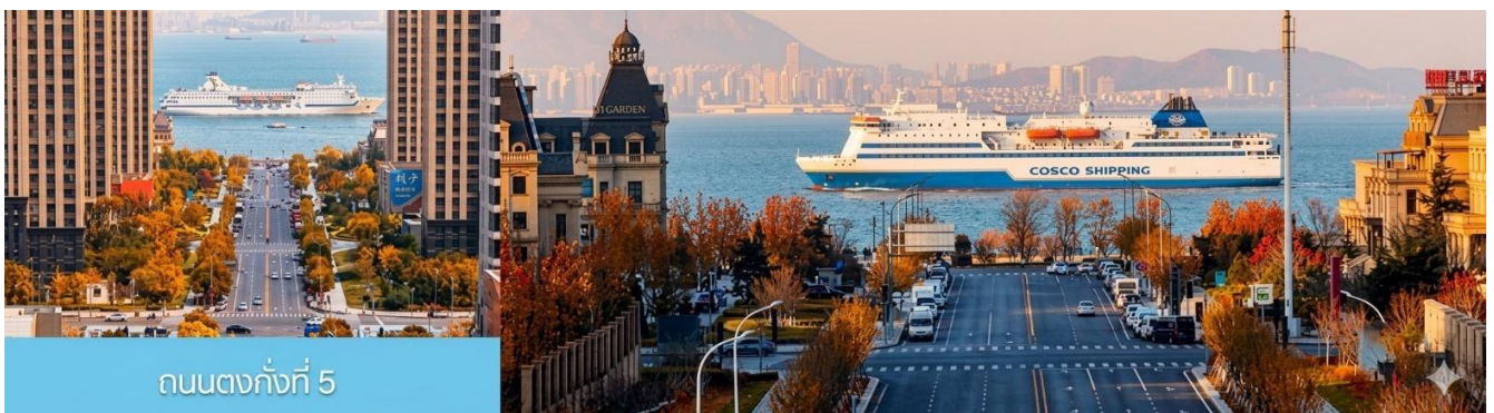
ถนนกั๋งตงที่ 5

เที่ยง รับประทานอาหารกลางวัน ณ ภัตตาคาร (5)