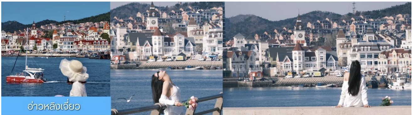
อ่าวหลังเจี้ยว

จากนั้นนำท่าน เที่ยวชม ท่าเรือประมงหู่ทาน 大连渔人码头 เป็นจุดเช็คอินที่โดดเด่นด้วยสถาปัตยกรรมสไตล์ยุโรปสีสันสดใส ผสมผสานกลิ่นอายเมืองท่าดั้งเดิมเข้ากับบรรยากาศสุดโรแมนติคที่เต็มไปด้วยเรือประมง คาเฟ่ ร้านอาหาร และจุดชมวิวยุริมาทะเล