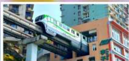
รถไฟฟ้าลู่ติ๊ก