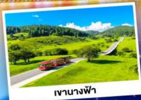
เจานางฟ้า