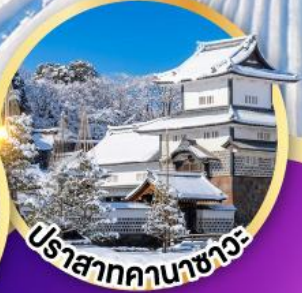
ปราสาทคานาซาวะ