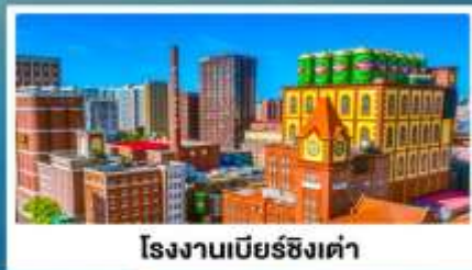
โรงงานเบียร์ซิงเต่า