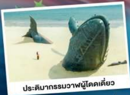
ประติมากรรมวาฬโคดเคียว

เที่ยวเมืองชายทะเลโอปิตีดี ซิงเต่า - ต้าเหลียน - ฉะเจียงไถ่