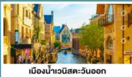
เมืองน้ำเวนิสตะวันออก