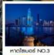
หาดโซเบอร์ NO.3

ขวดเบียร์สกรีนรูปของท่าน รับฟรี!! ท่านละ 1 ขวด