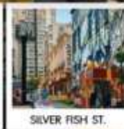
SILVER FISH ST.