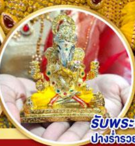
รับพระพิฆเนศวร ปางรำรอย ท่านละ 1 องค์