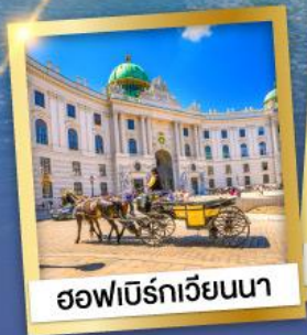
ออฟเบิร์กเวียนนา

เข้าชมความงดงามภายใน ของปราสาทนอยชวานสไตน์