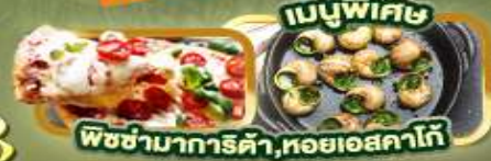
พิซซ่ามารีต้า, ทอยเอสคาโก้