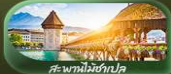
สะพานไมซ์าเปิล

เดินทาง 02-10 เม.ย. 69 / 04-12 เม.ย. 69 24 เม.ย. - 02 พ.ค. 69 29 เม.ย. - 07 พ.ค. 69 / 29 พ.ค. - 06 มิ.ย. 69