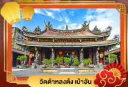
วัดต้าหลงตั้ง เป่าอัน